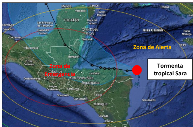
Ubicación en la zona de Alerta y posible trayectoria de la tormenta tropical Sara

A medida que el sistema se vaya acercando a Guatemala incrementará los nublados sobre todo el país con lloviznas o lluvias copiosas e intermitentes principalmente en las regiones Norte, Franja Transversal del Norte y Caribe, sin descartar lluvias importantes sobre el resto del país. Así mismo la cobertura nubosa promoverá el descenso de las temperaturas diurnas especialmente al norte del territorio nacional, donde la velocidad del viento podría alcanzar valores entre los 40 a 60 km/h.